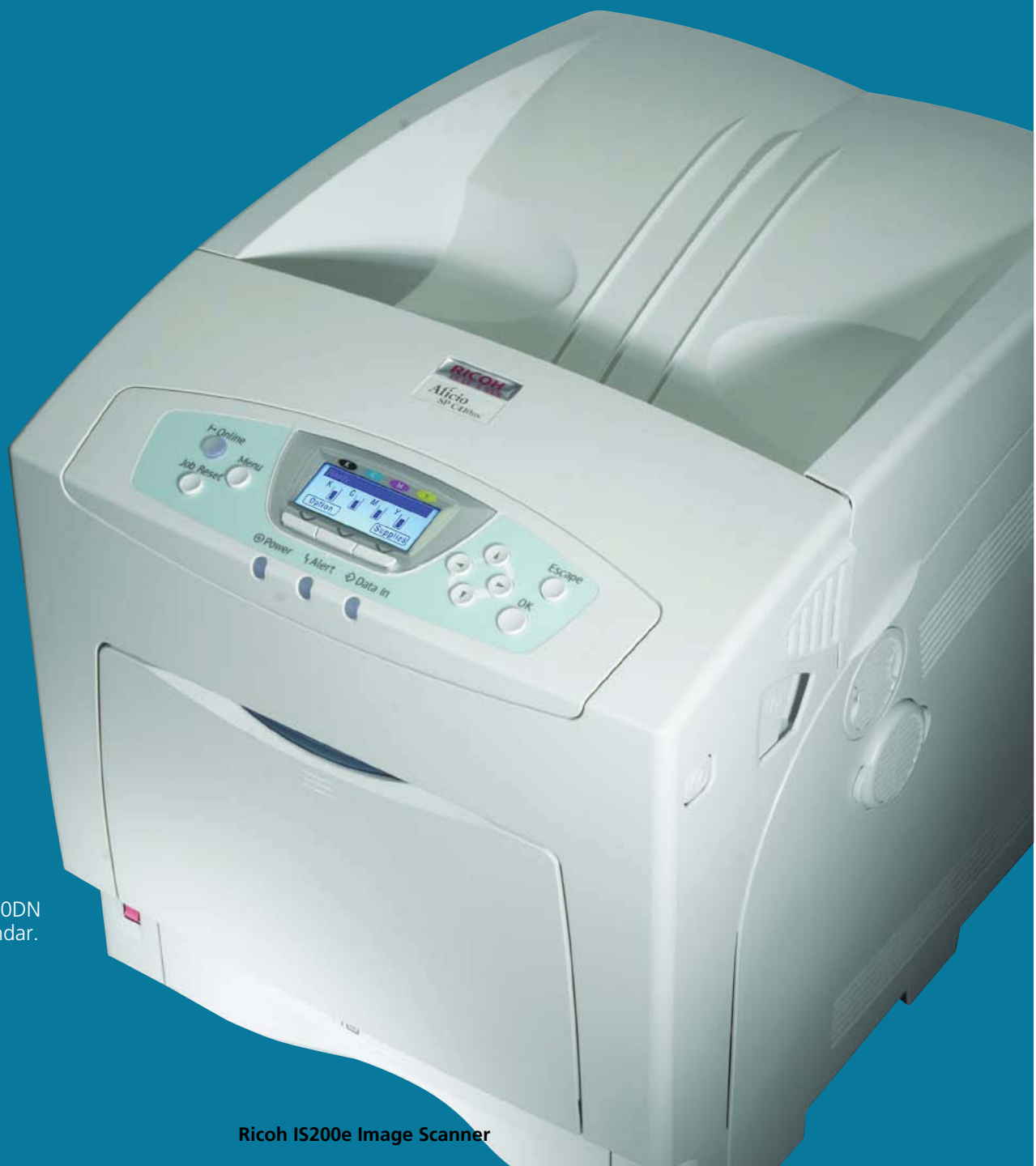
Ricoh Aficio SP C410DN Configuración estándar.

Pasar de blanco y negro a color es más sencillo de lo que se imagina gracias a las impresoras láser en color RICOH® Aficio® SP C410DN/ SP C411DN. Ello se debe a que combinan colores cautivantes con accesibilidad en sistemas que brindan altas velocidades de impresión, gran confiabilidad, impresión automática estándar de doble faz e insumos de alto rendimiento.