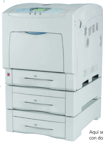
Aquí se muestra con dos bandejas opcionales

* La SP C410DN y la SP C411DN incluyen cartuchos iniciales de tóner que tienen un rendimiento de 3000 páginas con una cobertura del 5%; todos los demás insumos se suministran al máximo rendimiento. Las especificaciones están sujetas a cambios sin aviso.