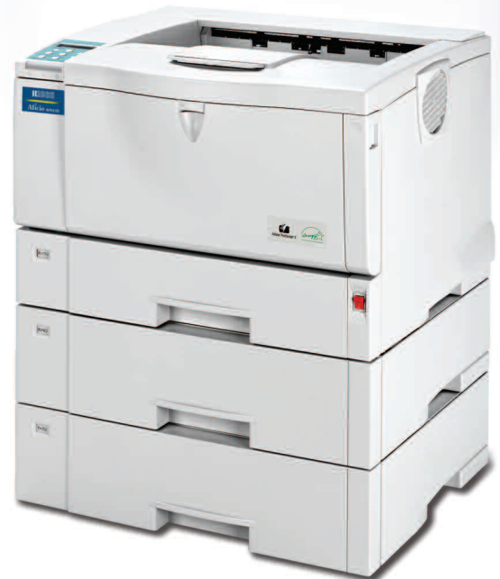
Ricoh Aficio AP610N totalmente configurada

Cuando el tiempo es oro, esta poderosa impresora no lo defraudará. Su suministro de papel expansible, fácil mantenimiento, utilitarios intuitivos de administración y amplia variedad de opciones de conectividad, incluyendo inalámbrica, le permitirán alcanzar máxima productividad en la oficina. Estableciendo un nuevo estándar para las impresoras utilizadas por grupos de trabajo, la perfecta integración en red, alta confiabilidad y rentabilidad de la AP610N la transforman en un dispositivo muy valioso... uno diseñado excepcionalmente para potenciar lo que se desee.