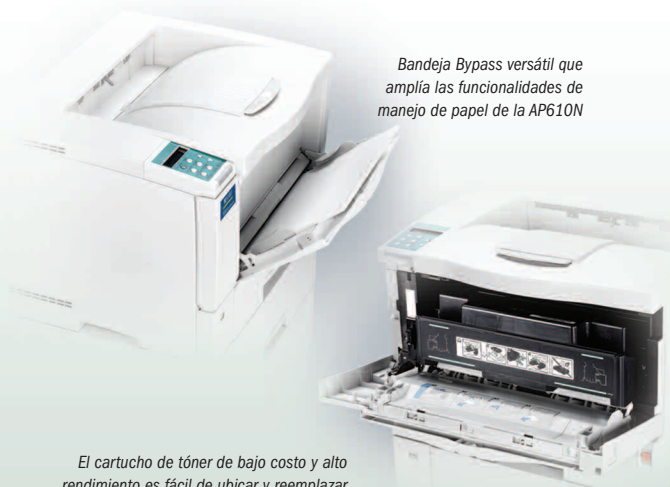
Bandeja Bypass versátil que amplía las funcionalidades de manejo de papel de la AP610N

El suministro de papel estándar de 500 hojas tiene capacidad para una resma completa de papel tamaño carta y también permite mayor flexibilidad con una bandeja bypass (estándar) para 100 hojas. Imprima en papel común de hasta 11" x 17" y en una amplia variedad de medios, incluyendo transparencias, tarjetas, papel reciclado y papel de tamaño personalizado. Imprima sobres con facilidad - hasta 10 a través de la bandeja bypass o 60 desde el Cassette para Sobres opcional. Reduzca el uso de papel y cubra espacios dejados en blanco con la Unidad de Doble Faz opcional . Incorpore una o dos bandejas de alimentación de papel para 500 hojas para aumentar así la capacidad total de papel a un máximo de 1.600 hojas al tiempo que minimiza las interrupciones de trabajo.